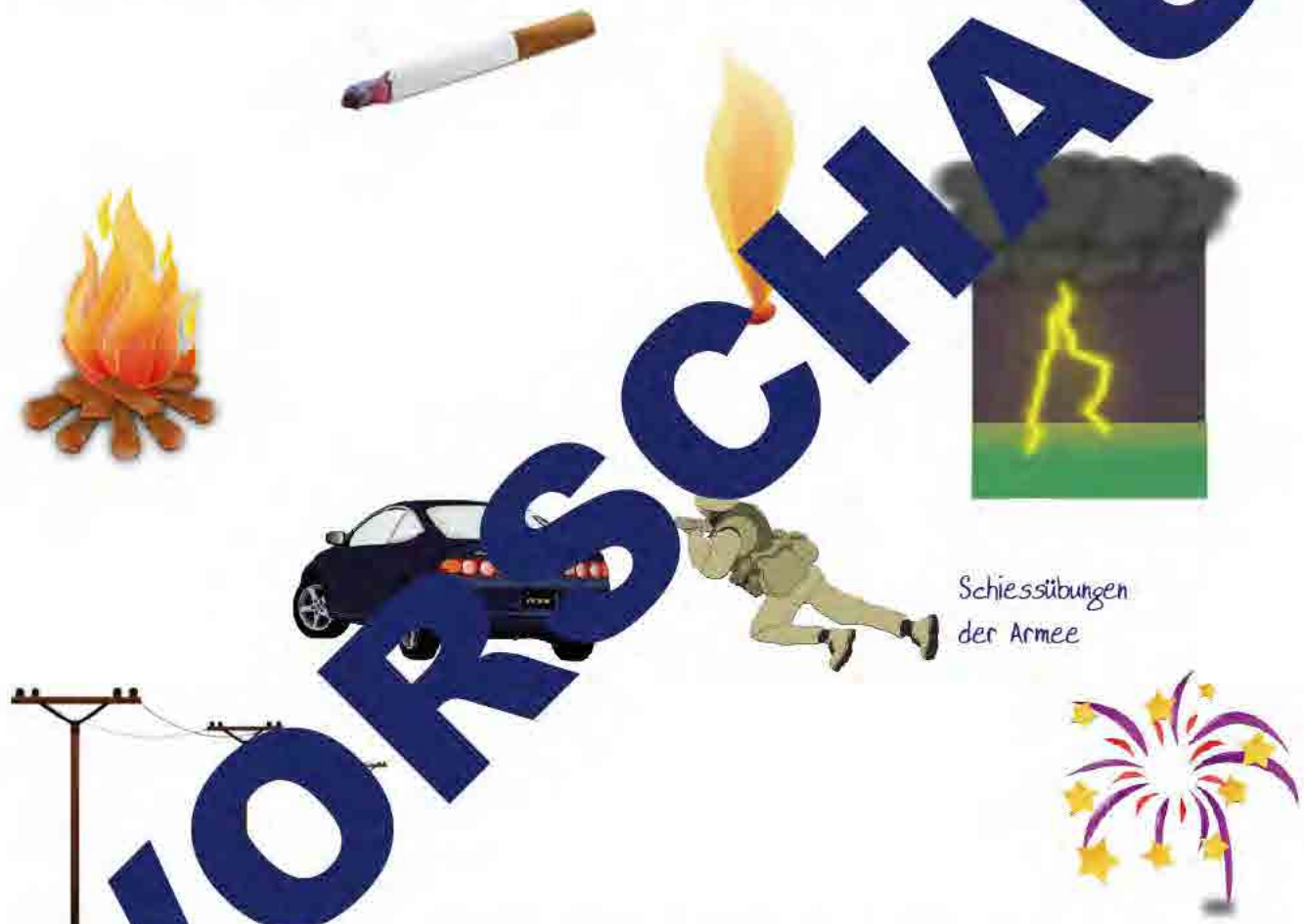
Schiesstübungen der Armee

Blitzentzündungen in Mitteleuropa normalerweise nur für kleinflächige Brände. Menschliche Landschaftseingriffe begünstigen grosse Waldbrände katastrophalen Ausmasses. Natürliche Laubmischwälder enthalten mehr Feuchtigkeit als Nutzwälder mit viel Nadelholz und lassen sich deshalb schlechter entzünden.